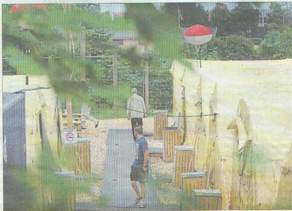
Teltlejren i Næstved er opstillet på Beredskabssyrelsens grund ved Bag Bakkerne.