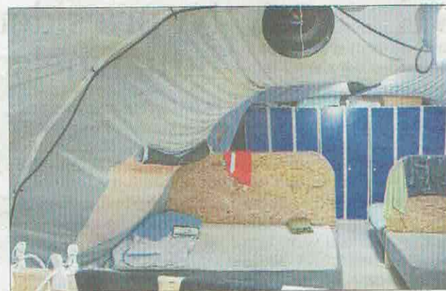
Der kan bo op til otte personer i hvert telt.

» Vi tager tingene, som de kommer. Det kan sagtens være spontant, men jeg lærer dem altid ord. Der er flere, der siger, at de lærer mere på sådan en tur, end de gør, når de er i skole.